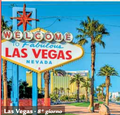
Las Vegas • 8° giorno