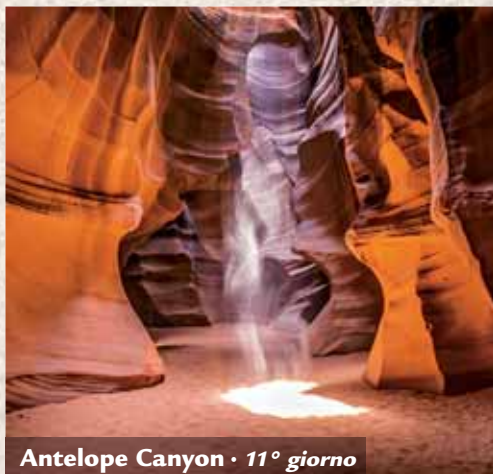
Antelope Canyon • 11° giorno