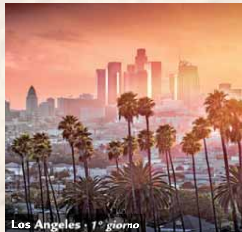
Los Angeles • 1° giorno