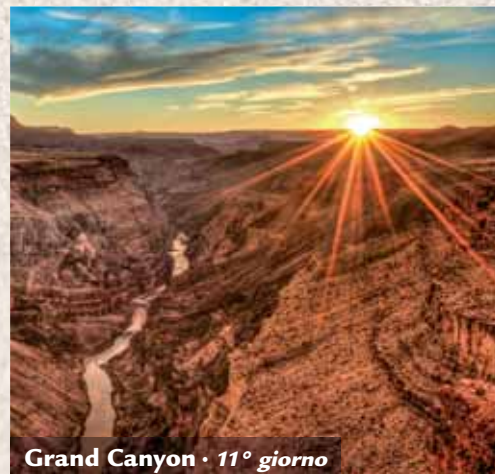
Grand Canyon • 11° giorno