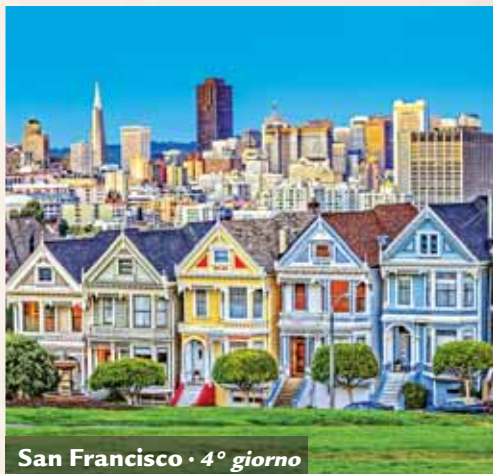
San Francisco • 4° giorno