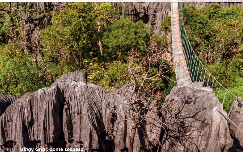
Tsingy Grigi, ponte sospeso